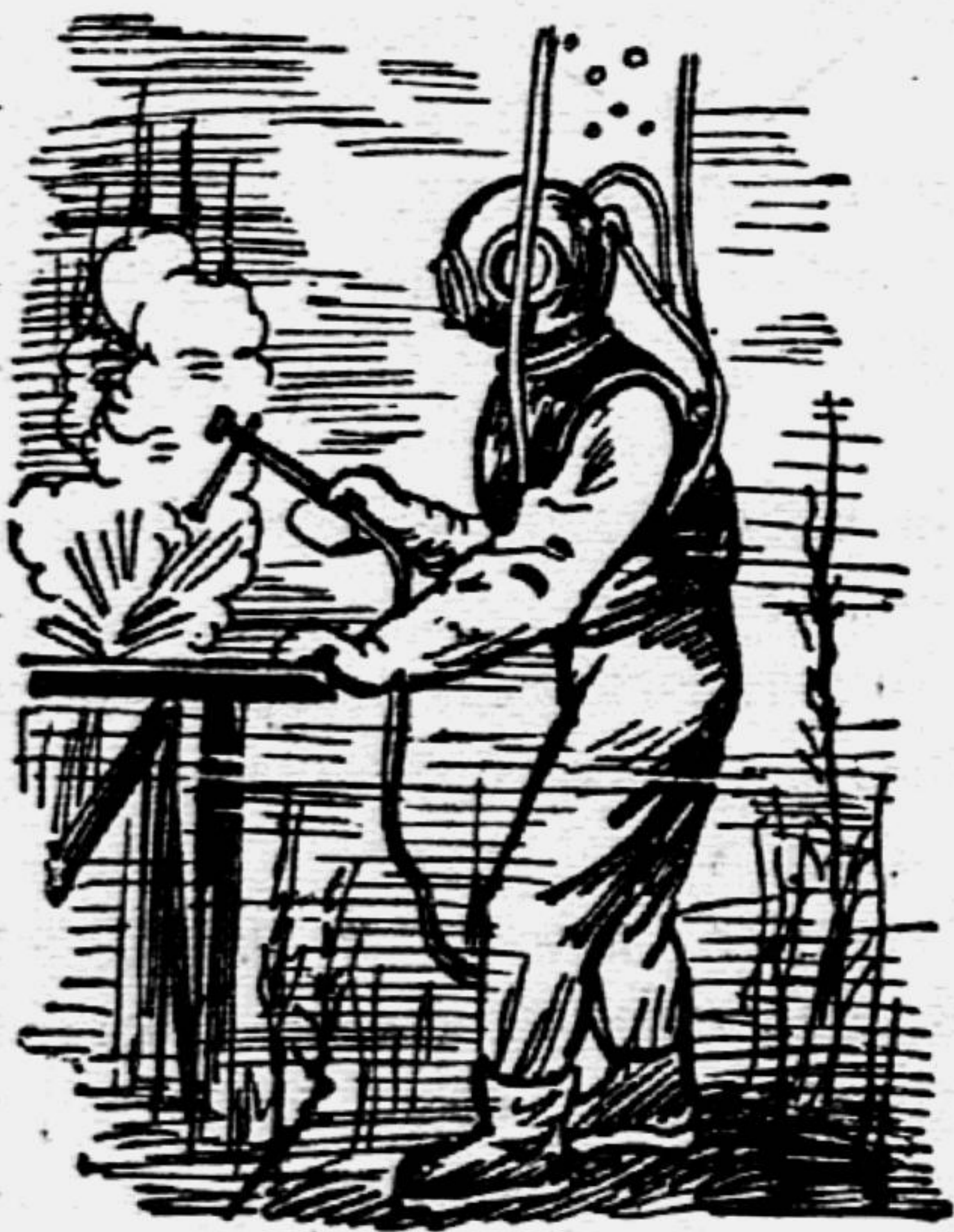
Водолаз включает ток, и яркое пламя вспыхивает в воде.

Можно ли резать и плавить металл под водой? Оказывается, можно. Водолазы спускаются на дно, зажигают вольтовые дуги, и яркое горячее пламя вспыхивает в воде.