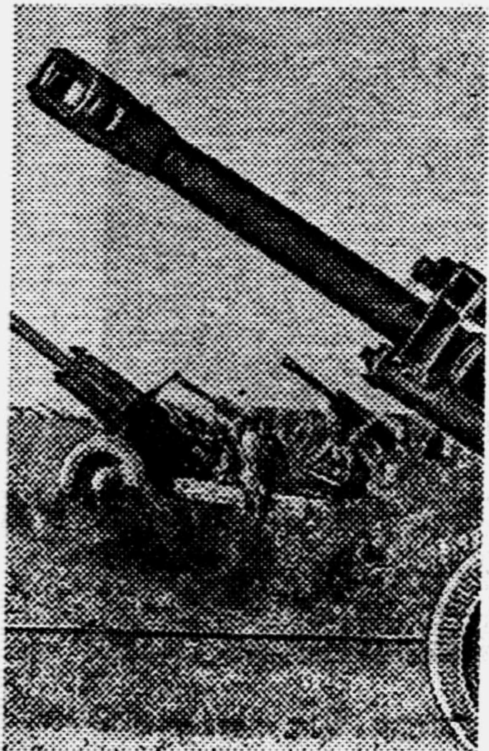
В боях под Ломжей. Советские орудия ведут огонь по врагу.

И они вдвоём опустили перед знаменем и поцеловали его. Окутанный дымом, батальон пошёл в атаку. Он протаранил оборону немцев и выполнил свою боевую задачу.