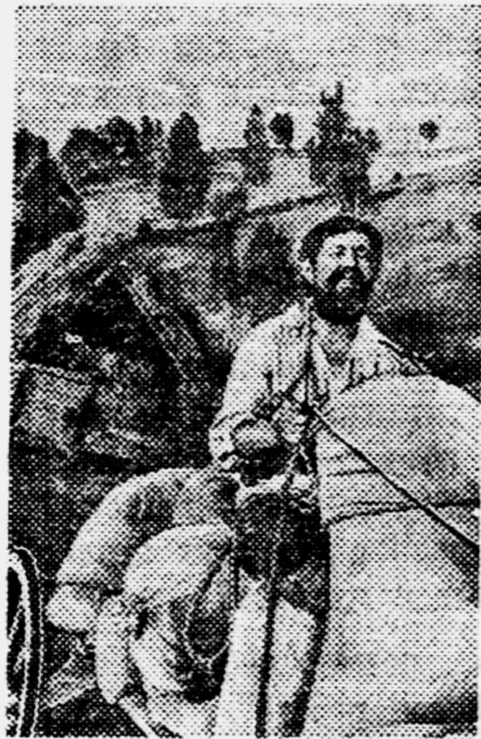
Посмотрите на снимок: возничок из колхоза «Наа-коух» везет на съёмной пункт хлеб нового урожая.

При советской власти Горная Шория преобразилась. Начаты большие работы по добыче руды, угля, построены железные дороги, заработали электростанции. На плодородной земле Шории зреет богатый колхозный урожай.